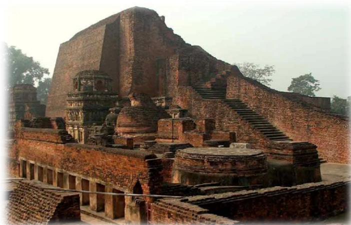
Nalanda University, Bihar

“La más potente arma en las manos del opresor es la mente de los oprimidos”. Steve Biko, Cape Town, 1971