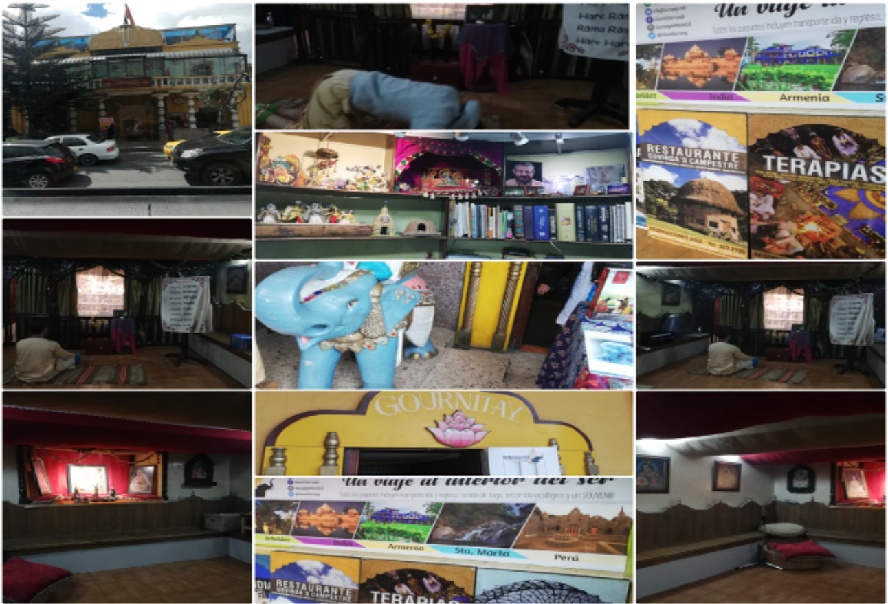
Carreño, S. (2018). Hare Krishna. [Imagen propia].